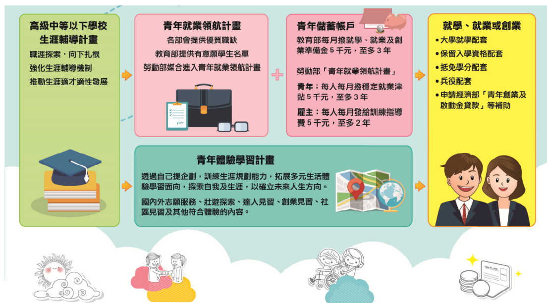
圖 2 青年教育與就業儲蓄帳戶方案具體架構圖