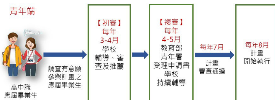
圖 4 青年體驗學習計畫申請途徑圖